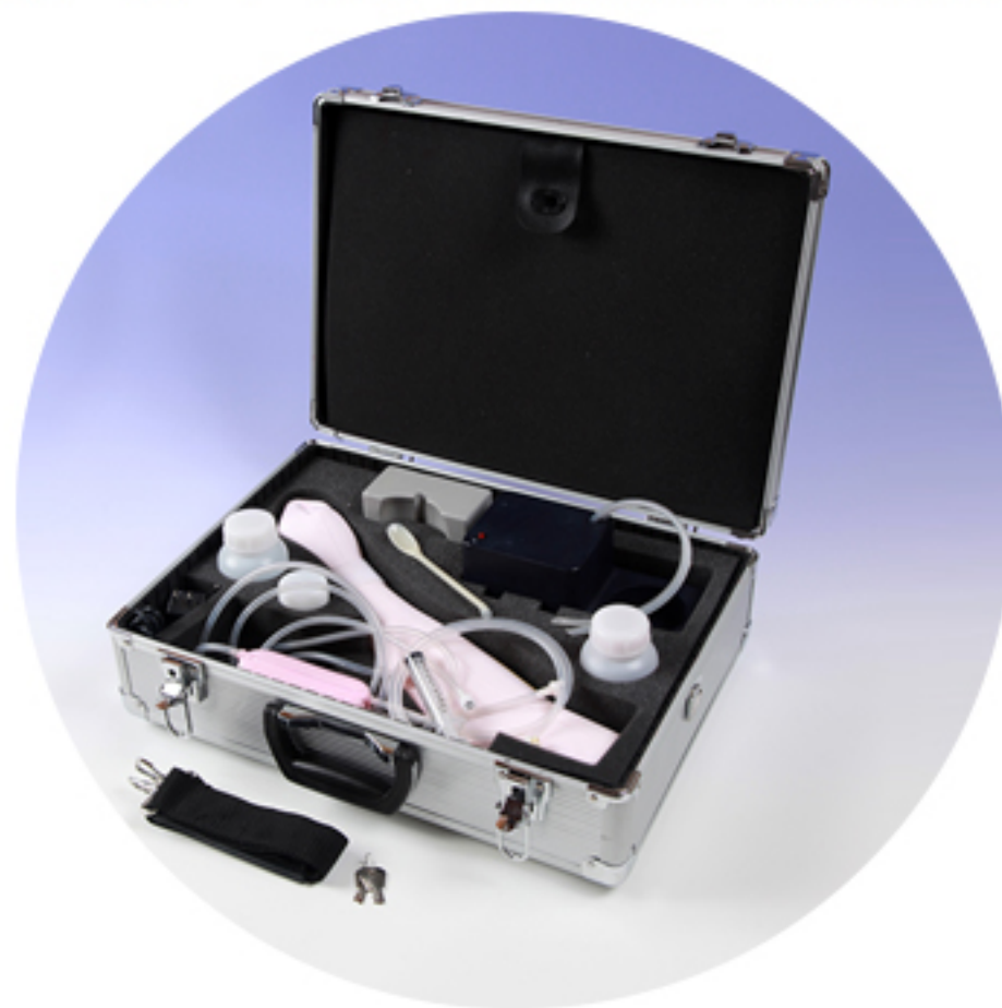
アルミ製アタッシュケース付