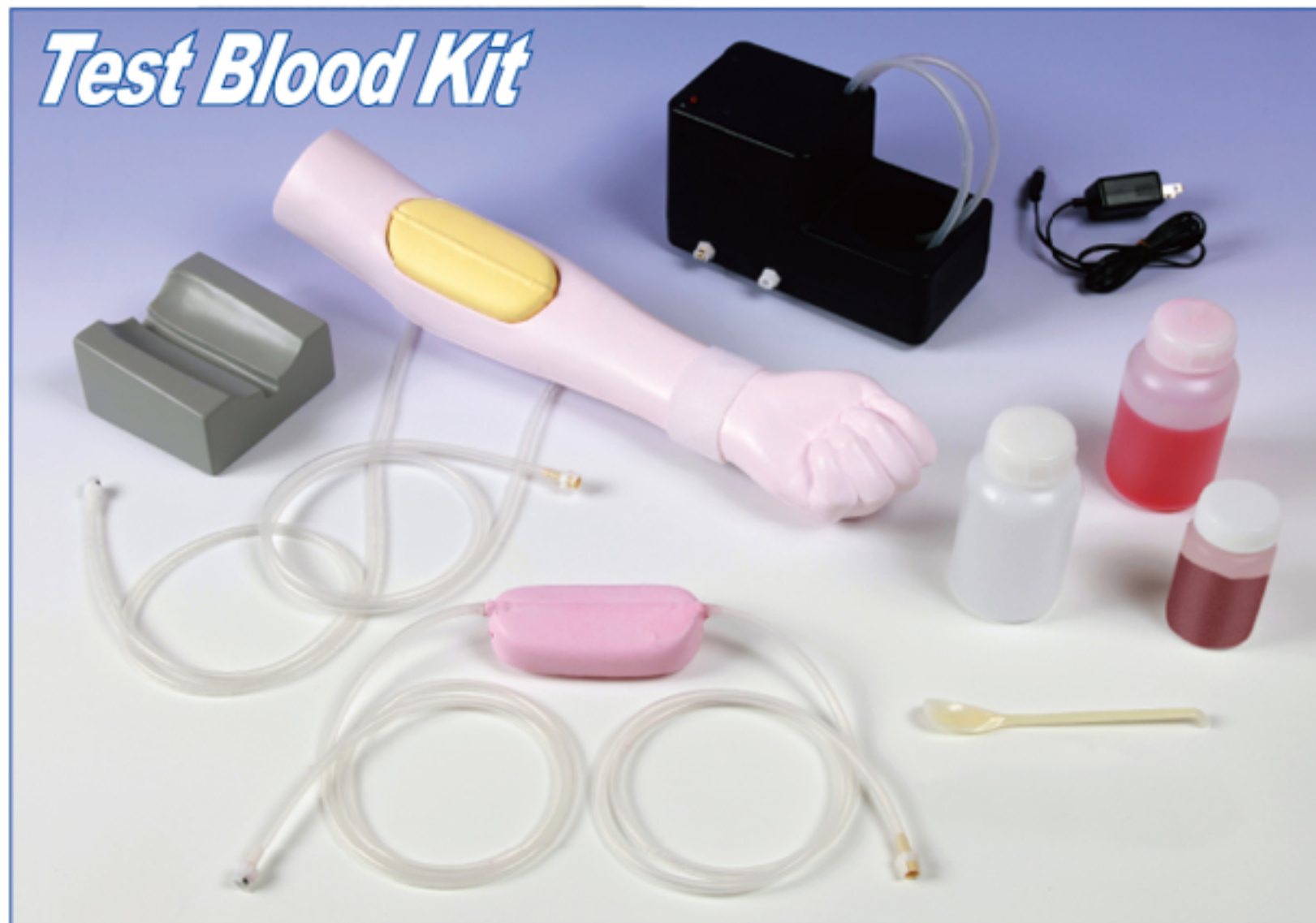
テストブラッドキット／本体セット【TS-2100】 アルミ製アタッシュケース付