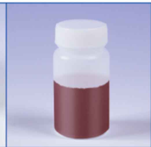
模擬血液 赤色粉末30g 【TS-350】

※注 消耗品のご購入は今回もしくは既に 動脈・静脈 採血・点滴リアルシュミレーション の本体をご購入の方のみの販売となっています